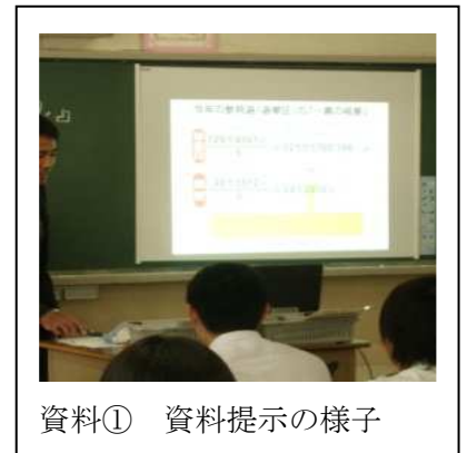
資料① 資料提示の様子